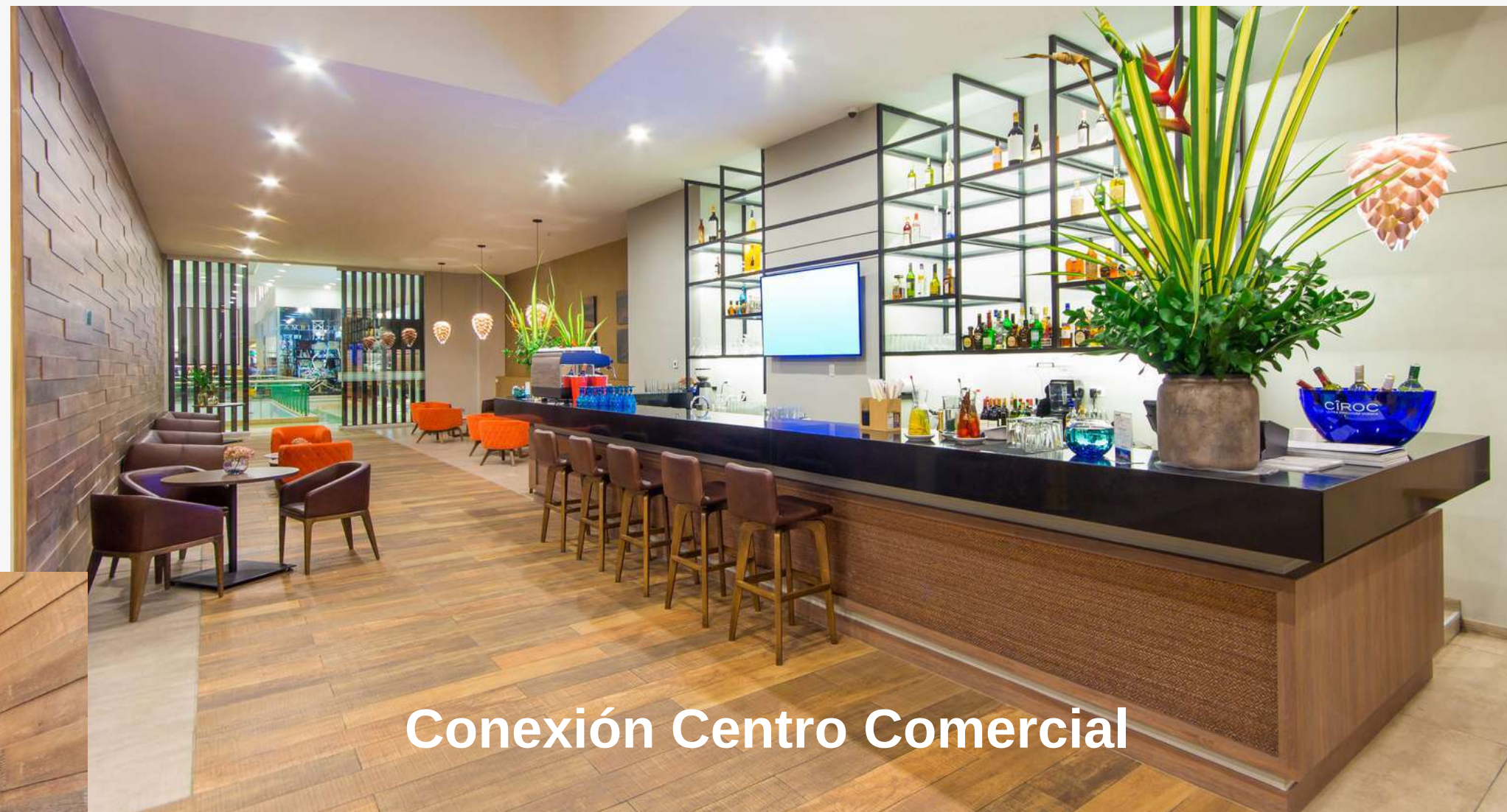
Conexión Centro Comercial