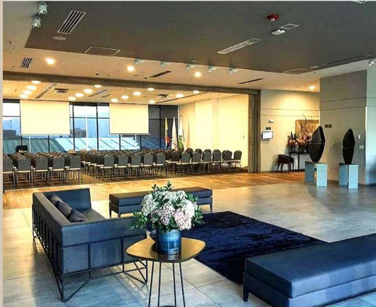
Salón Aburrá y Foyer